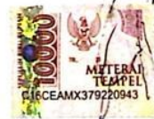
Wahyu Ichram Nasution NIM. 21020025