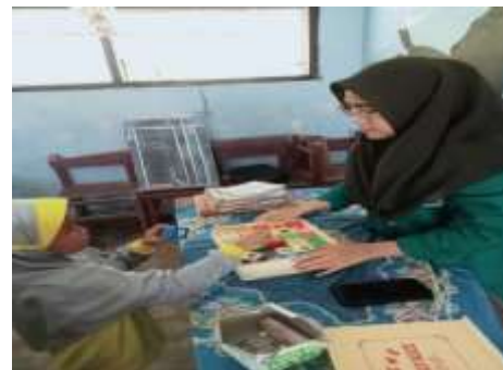
Gambar 5 dan 6 menjelaskan perbedaan huruf dan mencari huruf yang memiliki kemiripan