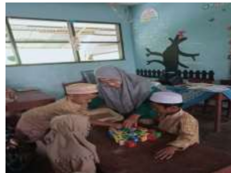
Gambar 3 dan 4 menjelaskan huruf dengan bentuknya dan menyusun huruf dengan berurutan