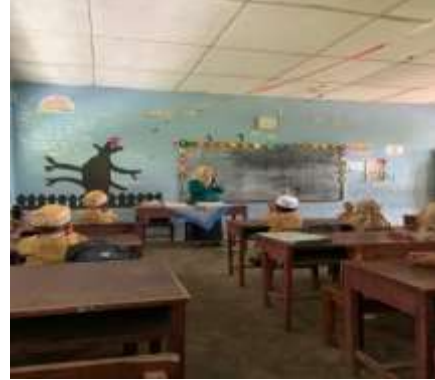
Gambar 1 dan 2 mengenal balok sambil bernyanyi alphabet