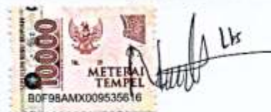
Nur Khofifah NIM. 20030024