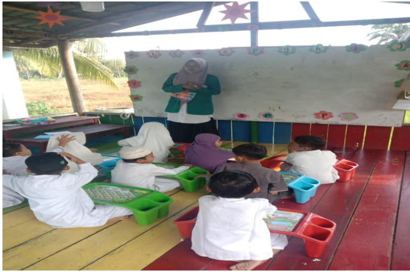
Gambar 1. Mengenalkan metode Al-Hira'