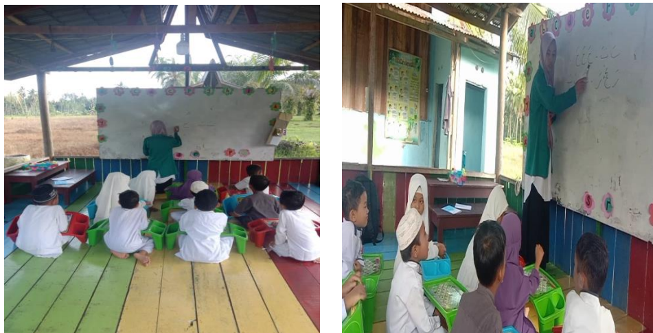
Gambar 2. Pelaksanaan pembelajaran metode Al-Hira' Siklus I