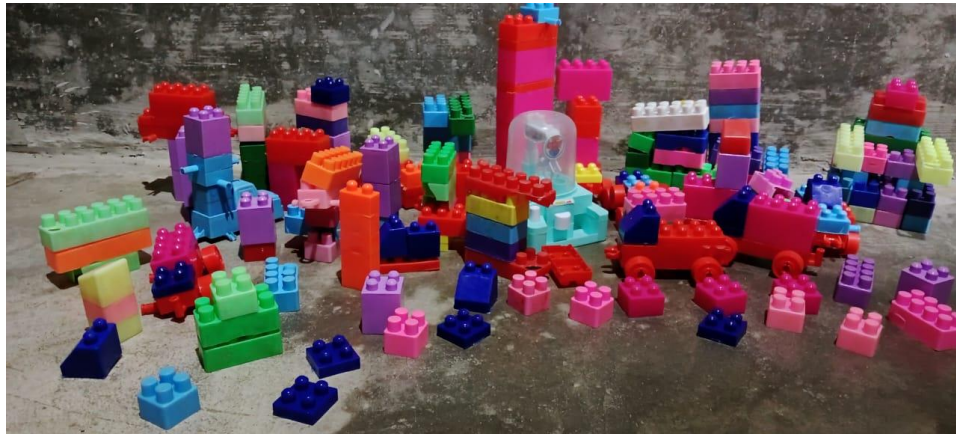
Gambar 5. Alat Permainan Edukatif RA Yaa Bunayya