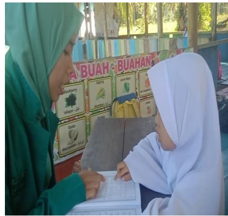
Gambar 3. Pelaksanaan pembelajaran metode Al-Hira' Siklus II