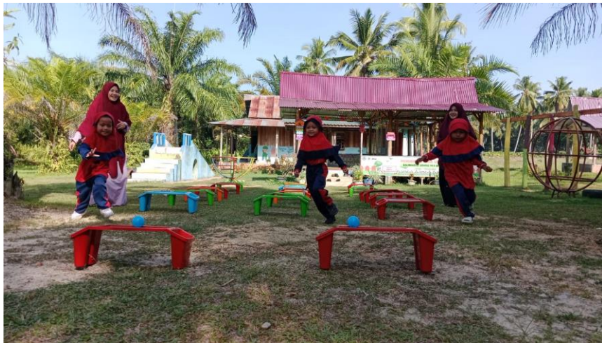
Gambar 4. Sekolah RA Yaa Bunayya