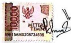
Kholilah NIM: 21140006

Panyabungan, Juni 2025 Yang membuat pernyataan