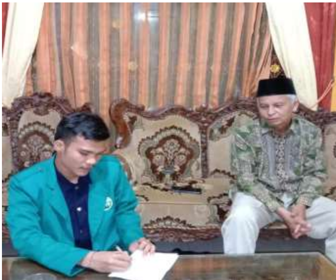
Dokumentasi dengan Nasabah BSI KCP Panyabungan