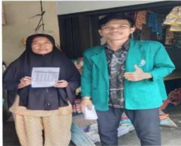
Dokumentas dengan Nasabah BSI KCP Panyabungan