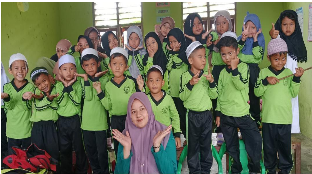
Gambar 6: foto bersama dengan anak-anak RA