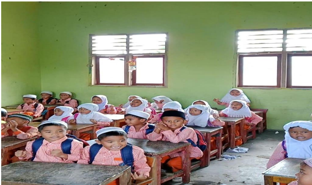
Gambar 4: guru memberikan kesempatan kepada anak-anak untuk menyanyikan lagu