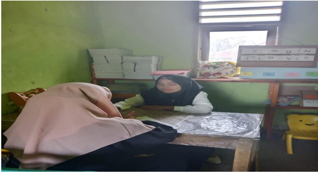
Gambar 5: Wawancara dengan kepala sekolah dan guru RA