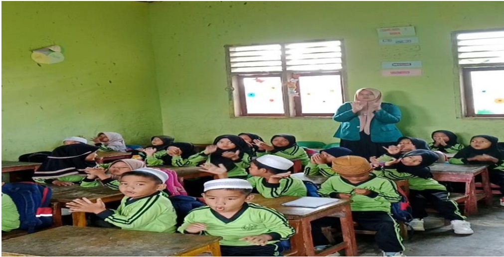
Gambar 3: guru mengajak anak bernyanyi bersama-sama dan membacakan lagu syair lagu baris demi baris