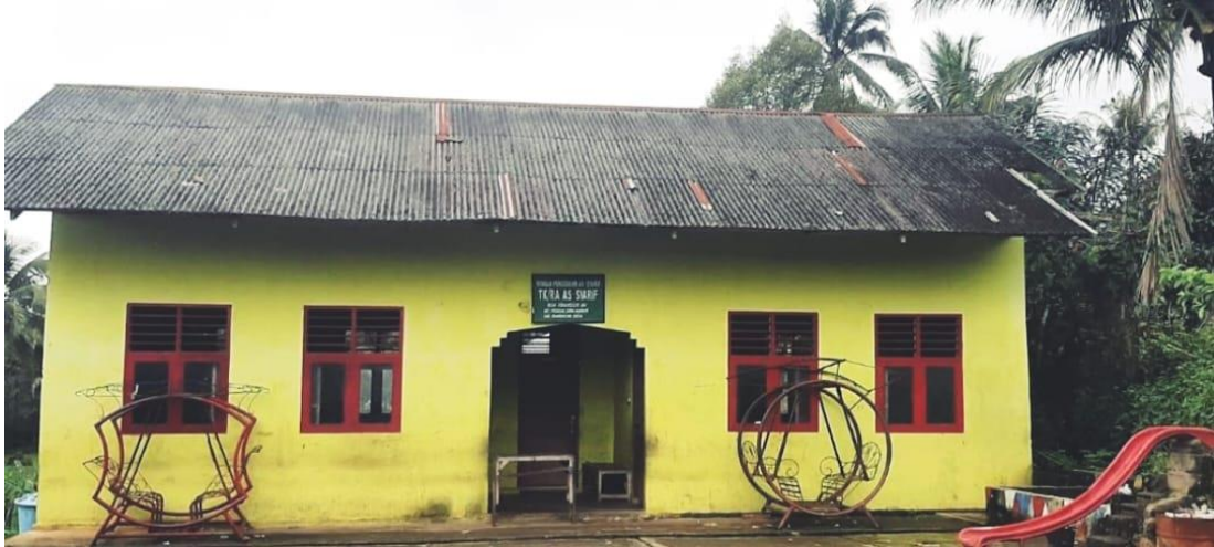
Gambar 1: RA As-Syarif Sibanggor jae