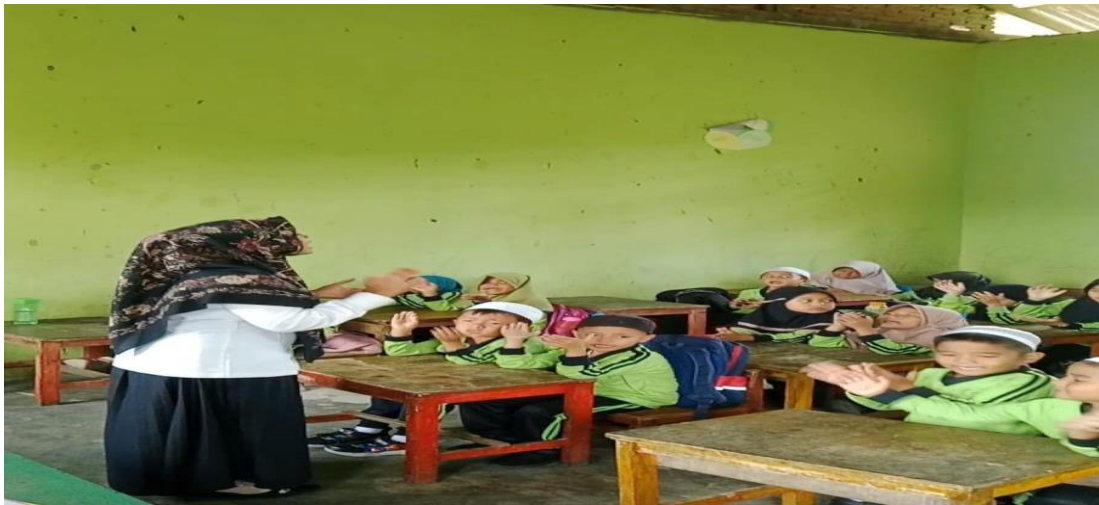
Gambar 2: guru menjelaskan isi nyanyian yang akan dinyanyikan kepada anak