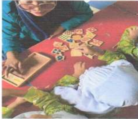
Dok. Mempragakan Alat Permainan Blok Angka Bergambar Pada Peserta Didik