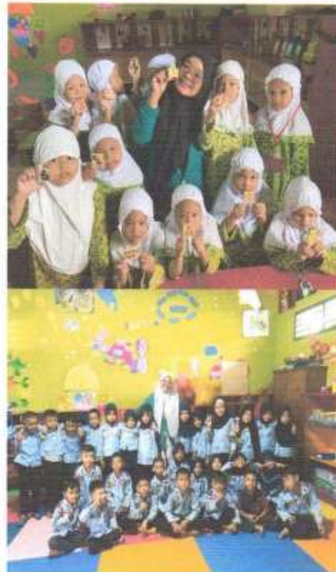
Dok. Dengan Peserta Didik Setelah selesai Penelitian