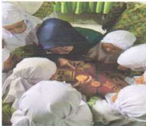
Dok. Peserta didik Memainkan Alat Permainan Blok Angka Bergambar