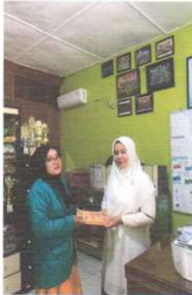
Dok. Observasi Prapenelitian