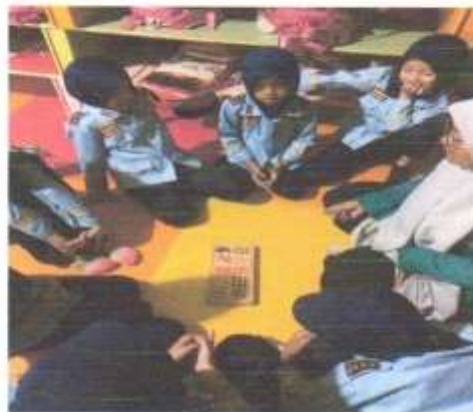
Dok. Memperkenalkan Alat Permainan Blok Angka Bergambar Pada Peserta Didik