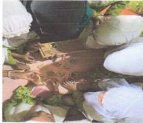
Dok. Peserta didik Mempragakan Alat Permainan Blok Angka Bergambar