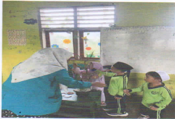
Kegiatan Menyangkutkan Huruf Hijaiyah