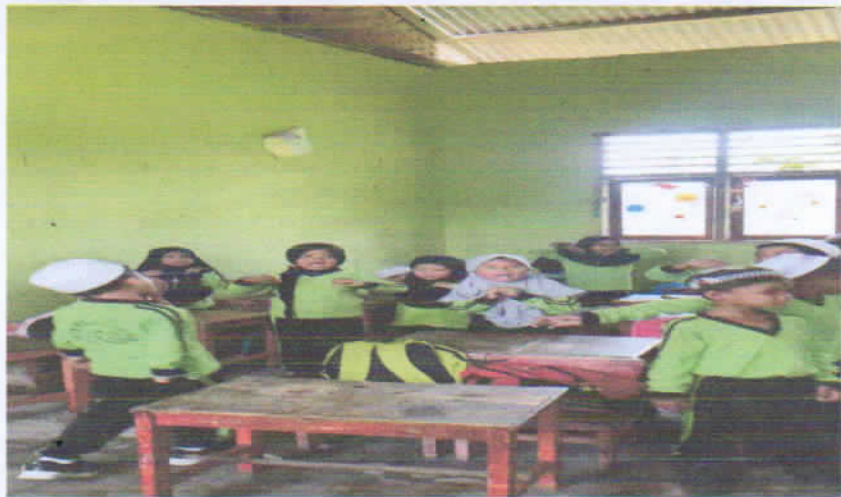
Kegiatan Pembukaan Pembelajaran