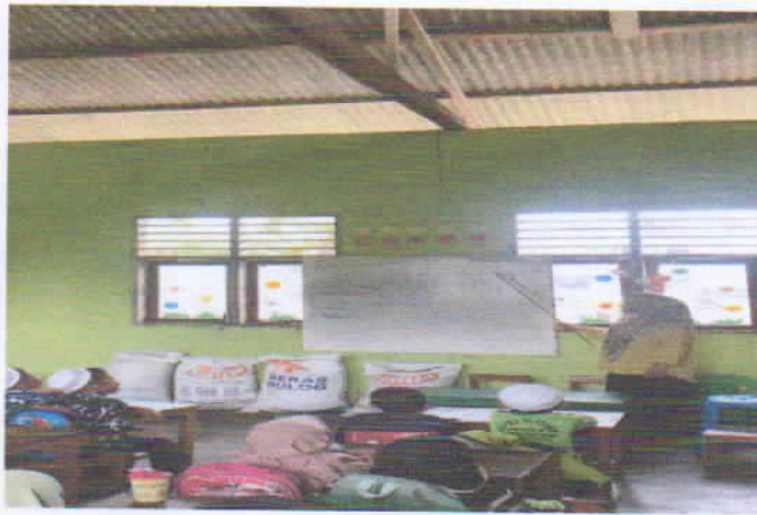
Kegiatan Membacakan Huruf Hijaiyah Bersama-Sama